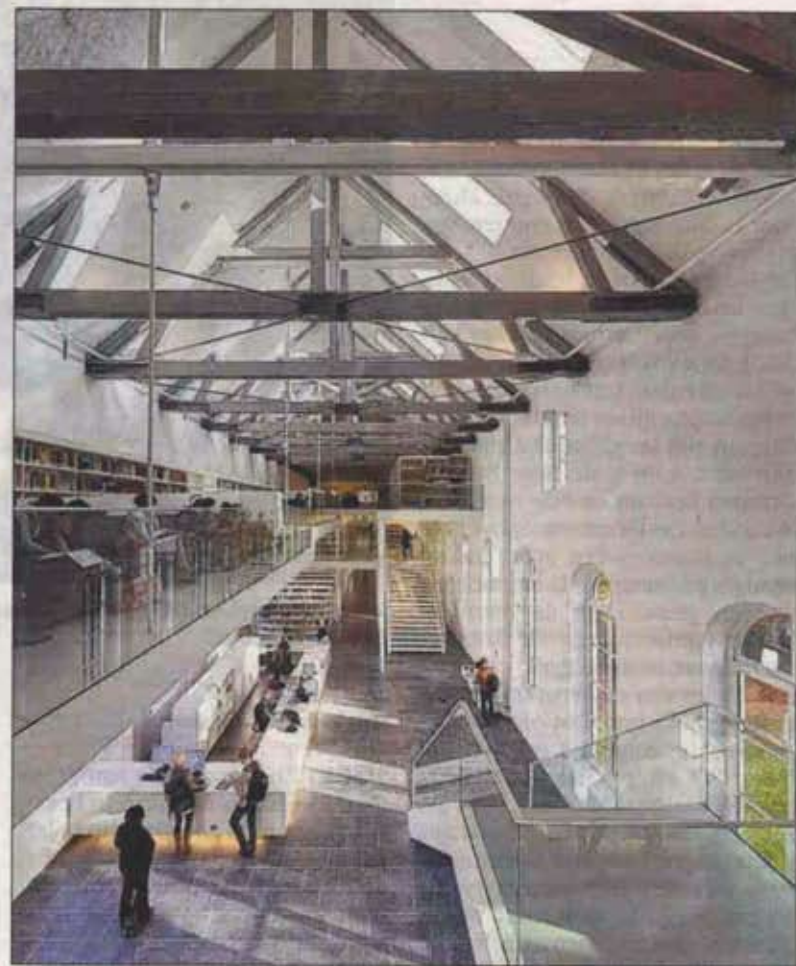
Grosfeld van der Velde Architecten uit Breda toverde de Utrechtse Universiteitsbibliothek om in een rustige, uitnodigende ruimte